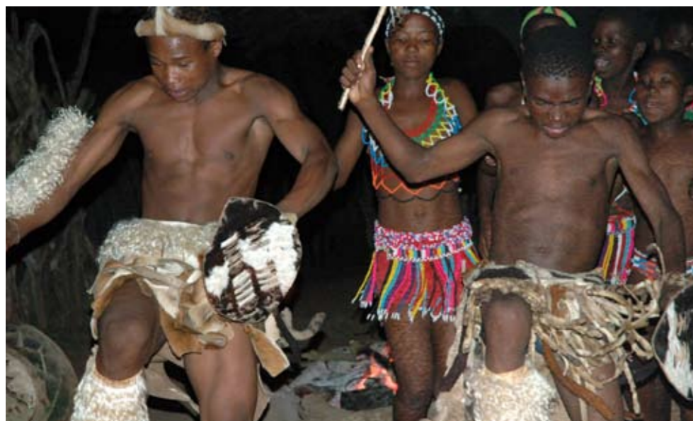
Danseoppvisning og kulturopplevelser får vi i Zululand

Etter frokost kjører vi gjennom fruktdalene og fortsetter til Jeppes Reef grensepost inn i Swaziland. Turen går videre via Pig's Peak-passet til hotell i "Den Kongelige" Ezulwini-dalen. På veien stopper vi på glassblåser-verksted, lunsj spiser vi underveis. Overnatting Lugogo Sun. (F/M)