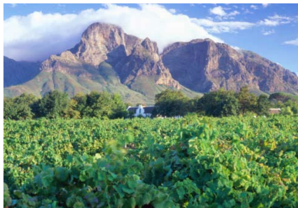
Området rundt Cape Town er kjent for sine mange gode viner